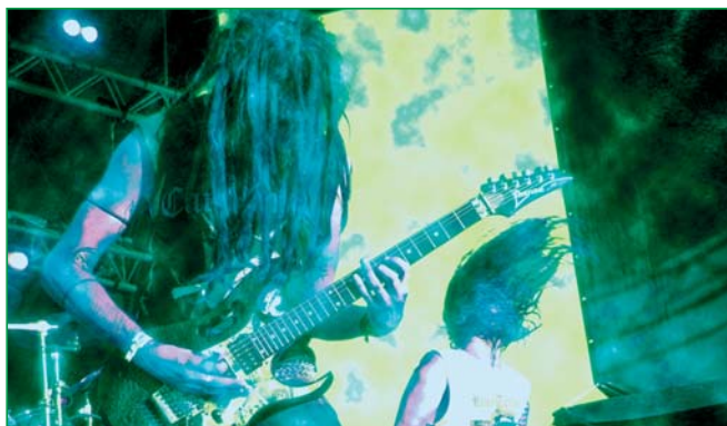
Cannabis Corpse au motocultor Festival

biais de l'usage thérapeutique. Alors que la majorité des états (surtout sur la côte est) prône encore une politique assez répressive.