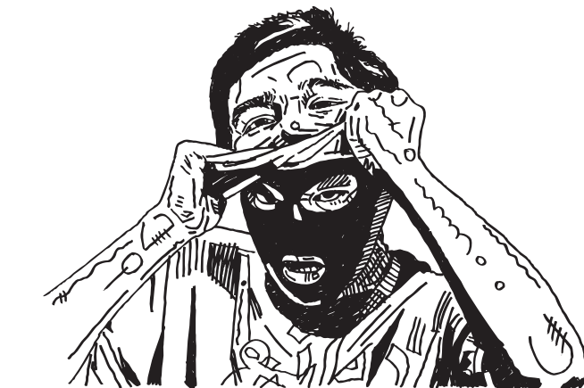
Illustration: Kiki © 2011

Par contre, c'est sur Internet que de nouveaux risques apparaissent avec cette nouvelle pratique: la MILDT (Mission Interministérielle de Lutte contre la Drogue et la Toxicomanie), chargée d'une pseudo-prévention et d'une vraie collaboration contre les usagers de drogues, s'en était émue l'an passé 8 . C'est pour quoi, en concertation avec les services chargés de traquer les terroristes et le grand banditisme, ils se sont attaqués aux cannabiculteurs en retraçant leurs communications électroniques 9 . En effet, c'est sur des