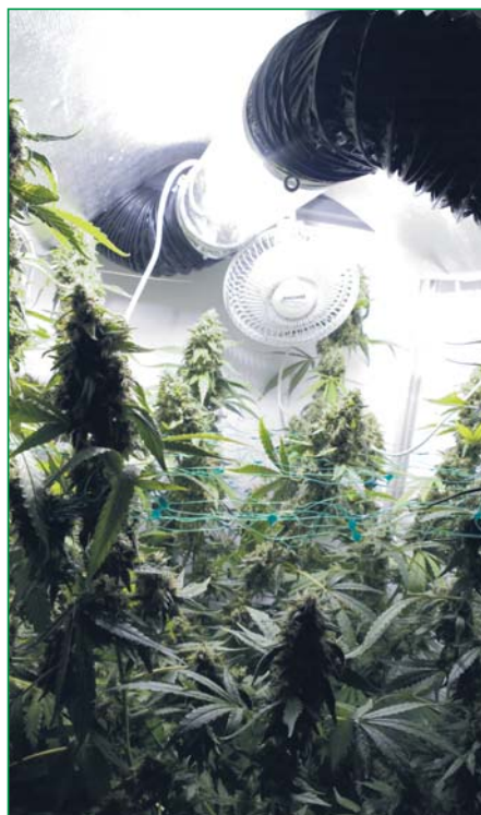
Interdit par la loi, jolie dans la vie : une « homebox maison »

Avec cette publication, nous souhaitons répondre à la question qui revient en permanence à mesure que s'accroît le phénomène des cultures en intérieur : quels sont les secrets de ces jardiniers en herbe ?