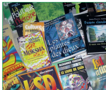
Pour cultiver son jardin intérieur © 2011 FARID - Paris, à la librairie Lady Long Solo

Ou les classiques du quotidien : Du Cannabis dans mon Jardin et Jardin d'Intérieur . Et là, on ne peut qu'avoir une pensée émue pour Culture en Placard (Closet Cultivator) d'Ed Rosenthal, qui a été l'objet de